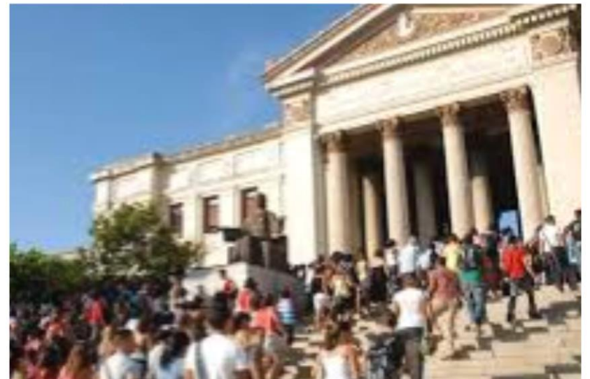
Formación de profesionales y superación postgrado