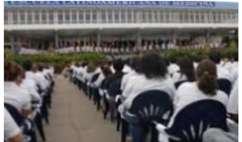
Programas de colaboración internacional