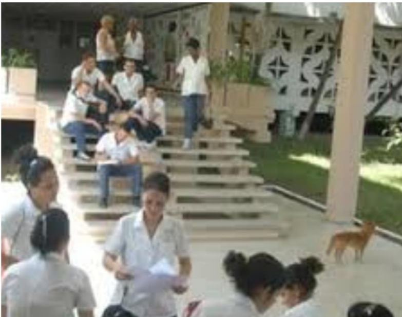
Formación integral de profesores