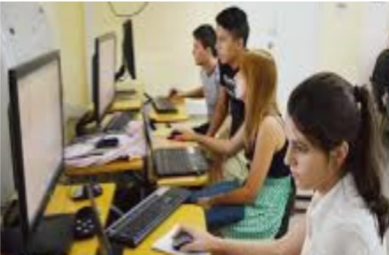
Empleo de las tecnologías de informatización